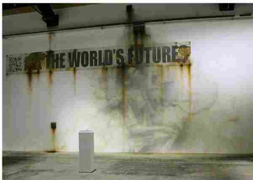
Eron, The World's Future, 2015, Biennale di Venezia

Mi piace Condividi Iscriviti per vedere cosa piace ai tuoi amici.